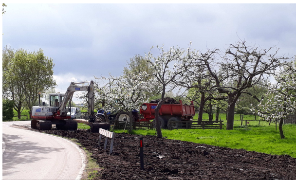
De demping bij Breeveld.