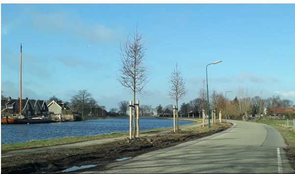
Nieuwe sierappelbomen langs Barwoutswaarder

Op het traject langs Barwoutswaarder is een groot deel van de werkzaamheden gereed. In de vorige nieuwsbrief is aangegeven dat er bomen gekapt moesten voordat het broedseizoen begon. Dit is gelukt, waarna de nieuwe bomen aangeplant zijn. Op de locatie van de gekapte bomen zijn in overleg met de gemeente sierappelbomen (Malus 'Evereste') terug geplant. Deze bomen worden maximaal circa 6 tot 8 meter hoog en bloeien in mei met witte bloemen in trossen. In de nazomer groeien er kleine, ongeveer 3 cm grote oranjeoranje sierappeltjes aan de bomen. Deze blijven tot ongeveer januari aan de boom hangen en zijn zeer geliefd bij vogels.