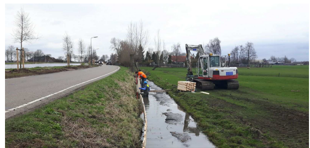
Het plaatsen van het kwelscherm

Ook langs Breeveld zijn veel bomen gekapt. Voor dit traject wordt samen met de bewoners en de gemeente een plan gemaakt voor de aanplant van nieuwe bomen. Op de locatie waar 4 oude eiken gekapt zijn, zijn er inmiddels vier nieuwe eiken geplant. Het dempen van de watergang is versneld uitgevoerd om het aanplanten van deze bomen nog dit plantseizoen mogelijk te maken. Dit was de nadrukkelijke wens van de omwonenden.